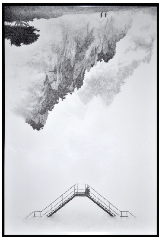
KLEMT You Know I Was Hopeful , 2015 Encre de chine et graphite sur papier 100 x 70 cm © Klemt Courtesy Galerie LWS

ATEF MAATALLAH (COLLECTIF ZAMAKEN), SECOND LAURÉAT